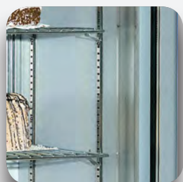
Estantes regulables en altura (Mod.estático)