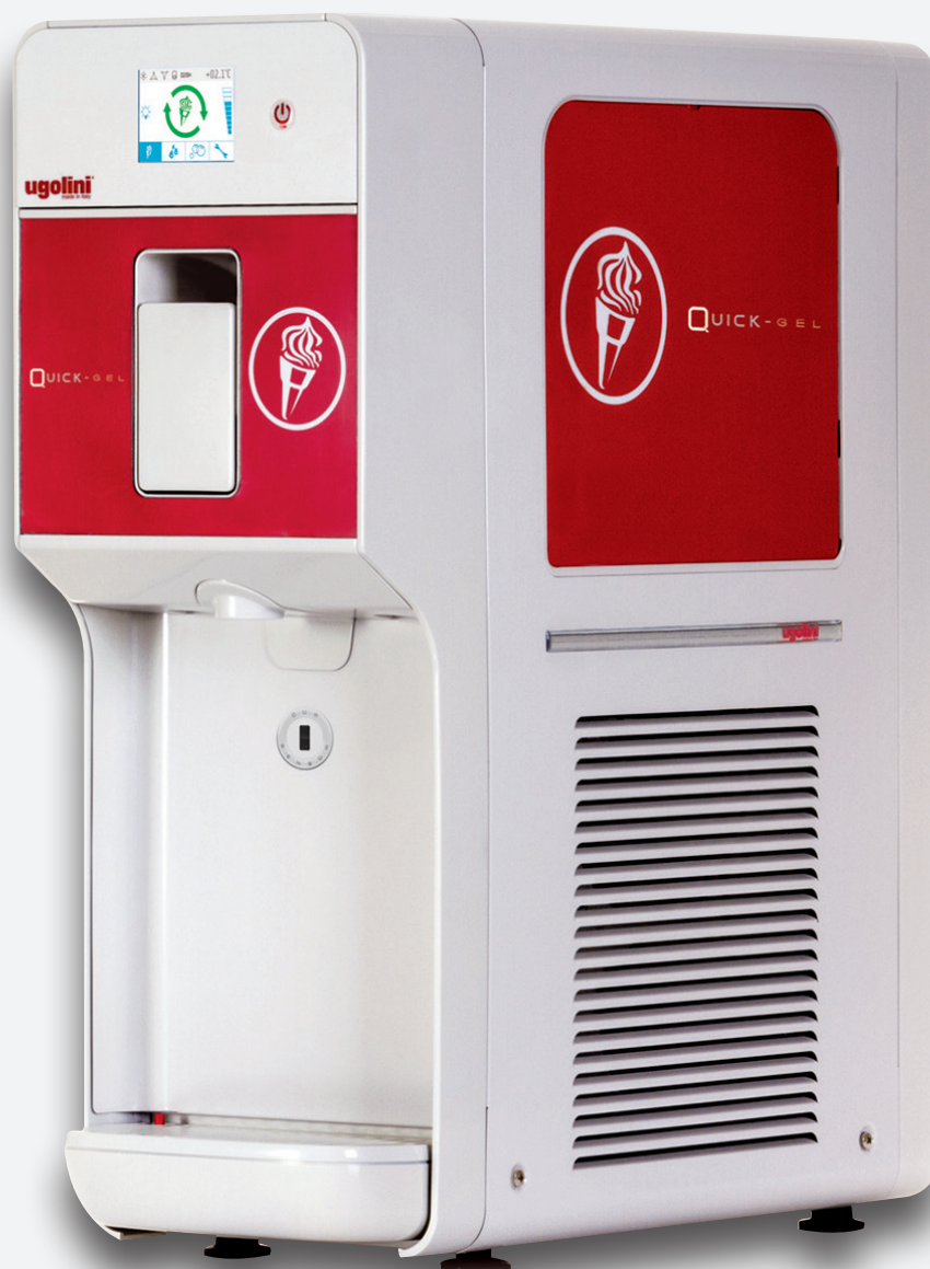
Mod. QUICKGEL MIXER