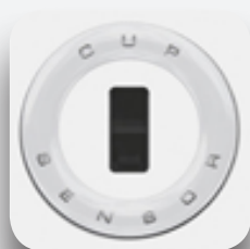
Sensor de proximidad.