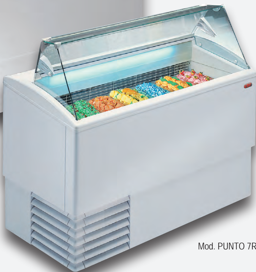
Mod. PUNTO 7R