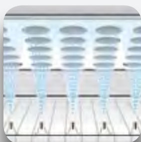
Sistema de rociado por aspersores.