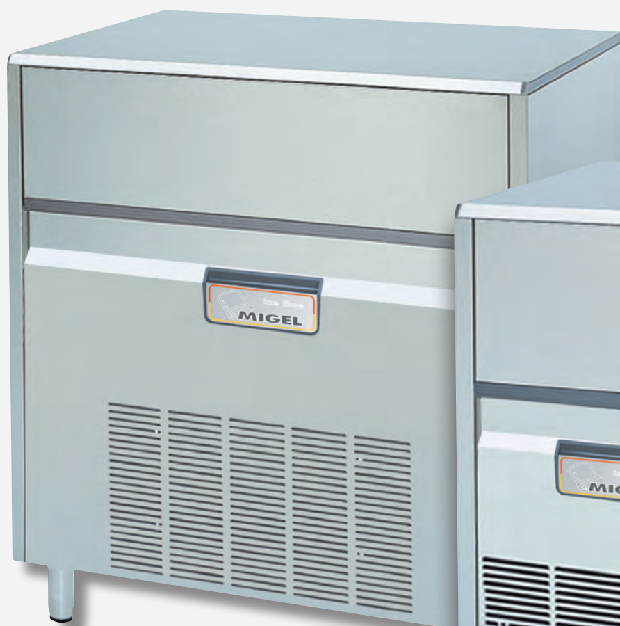
Mod. KX 132