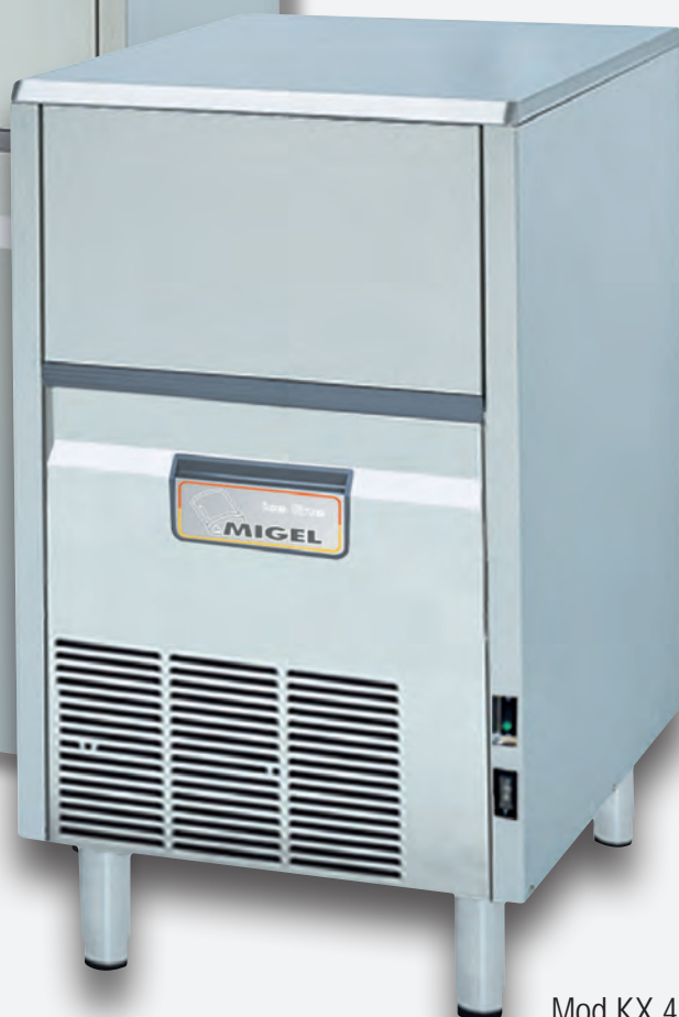
Mod. KX 42