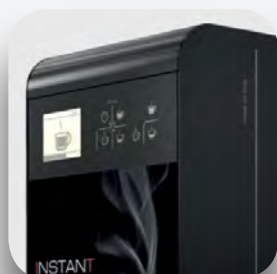
Pantalla informativa y teclado táctil.