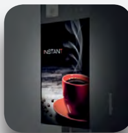
Frontal luminoso (opcional).