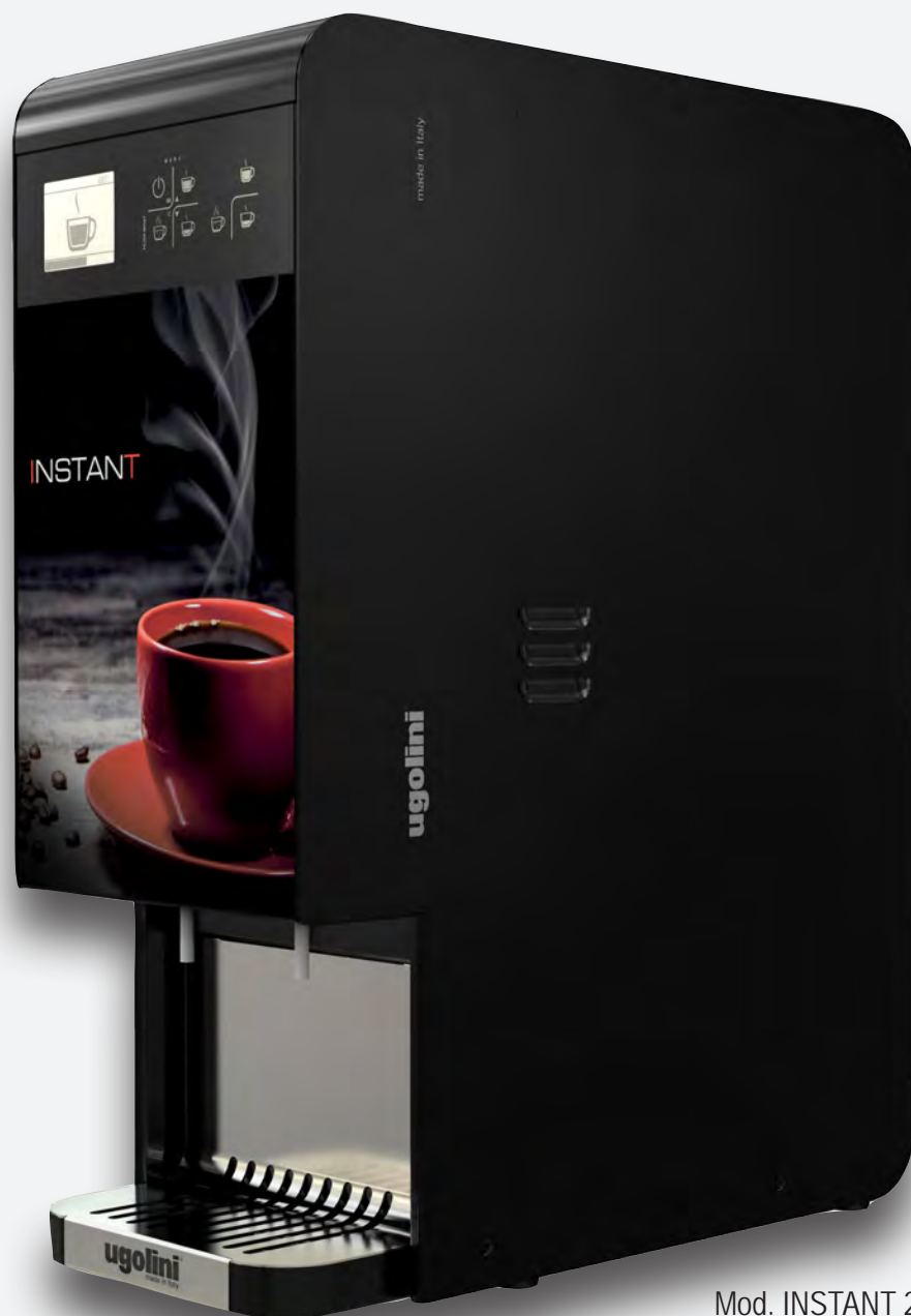
Mod. INSTANT 2