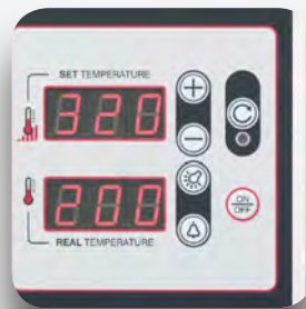
Control electrónico de la temperatura.