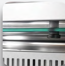
Cristal seguridad puerta.