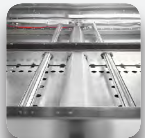
Quemadores con control electrónico de la llama.