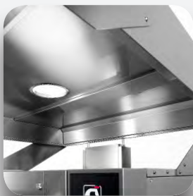
Conducto humos y campana.