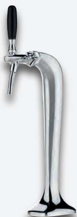
Mod. Cobra 1