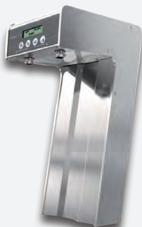
Mod. DRINK TOWER