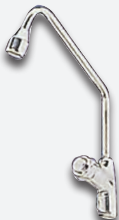
Mod. G 65