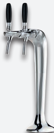
Mod. Cobra 2