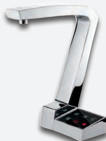
Mod. G7 EC