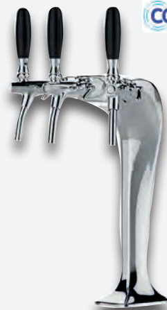
Mod. Cobra 3